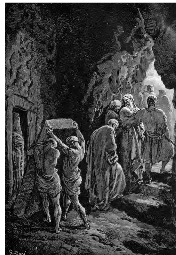
GUSTAVE DORÉ, The Burial of Sarah / Die Beerdigung von Sarah, 1866